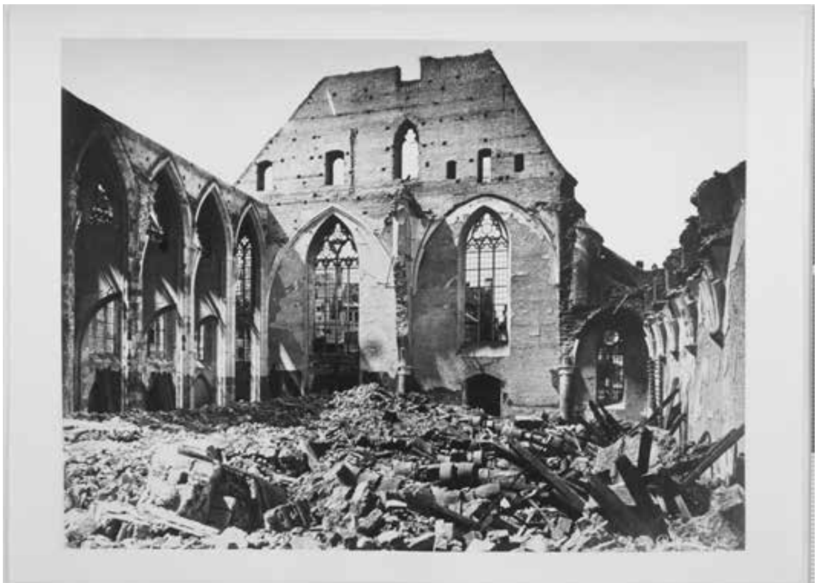
Le Temple Neuf en ruines... et l'ancienne Bibliothèque de la Ville anéantie (1870).

Jusqu'en 1870 : la bibliothèque du Temple Neuf ; l'incendie de 1870