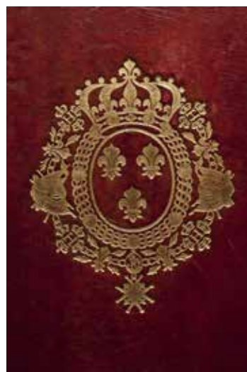
Une reliure « aux armes » (1747)