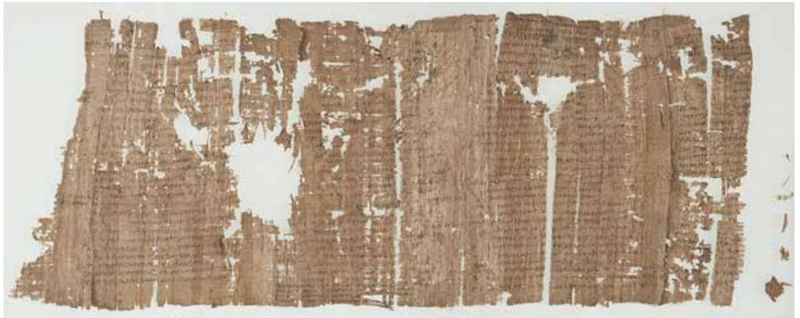
Papyrus grec (194 après J.-C.) / BNU - JPR