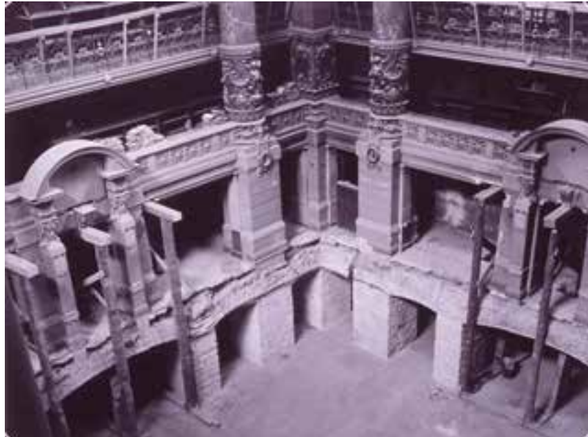
La grande salle de lecture après les bombardements de 1944