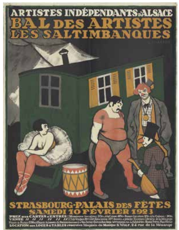
Affiche de Louis-Philippe Kamm (1923) BNU - JPR