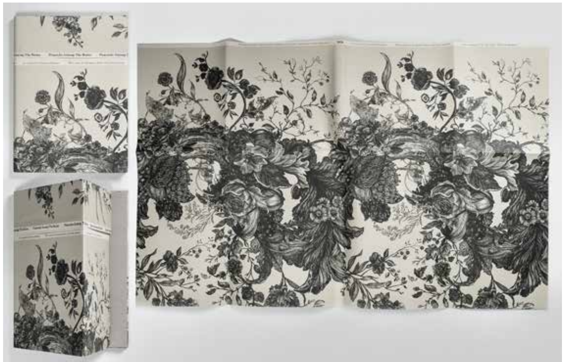
Un exemple de jaquette contemporaine (2007)