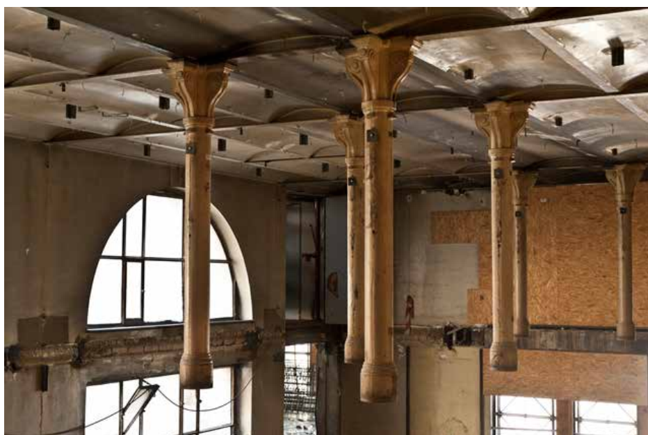
Les colonnes des anciens magasins conservés, pendant la période de démolition (2011)