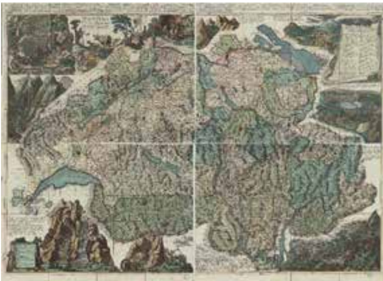
Carte de la Suisse (1712)