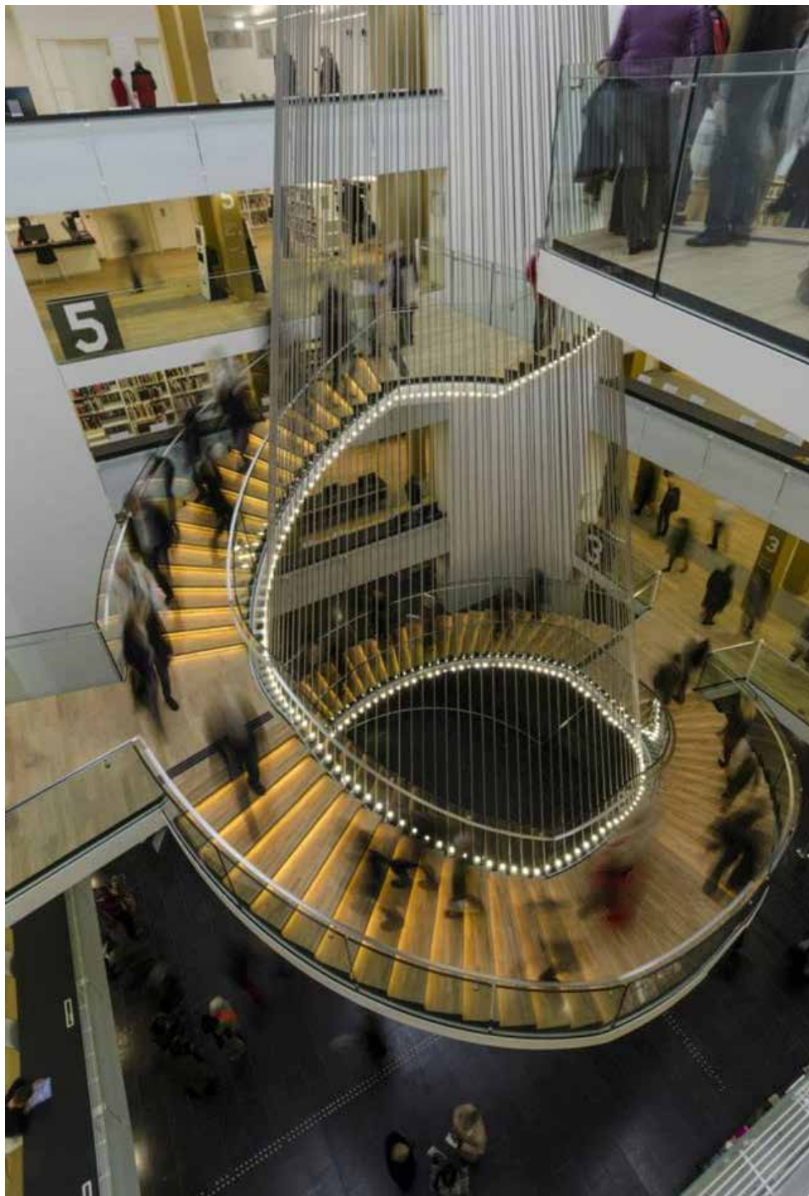
L'escalier monumental à la réouverture du bâtiment (Journées portes ouvertes en novembre 2014)