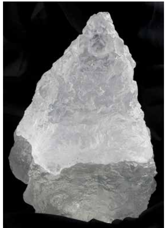
Un livre objet : La Pyramide des rêves (2001)