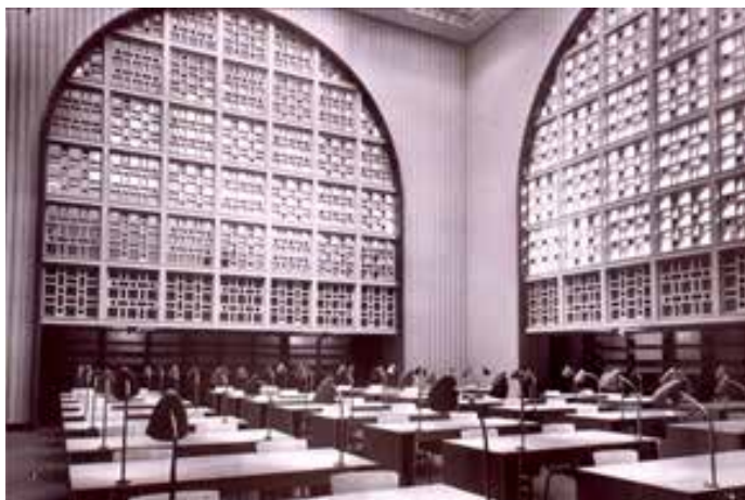
BNU, salle de lecture (vers 1960)