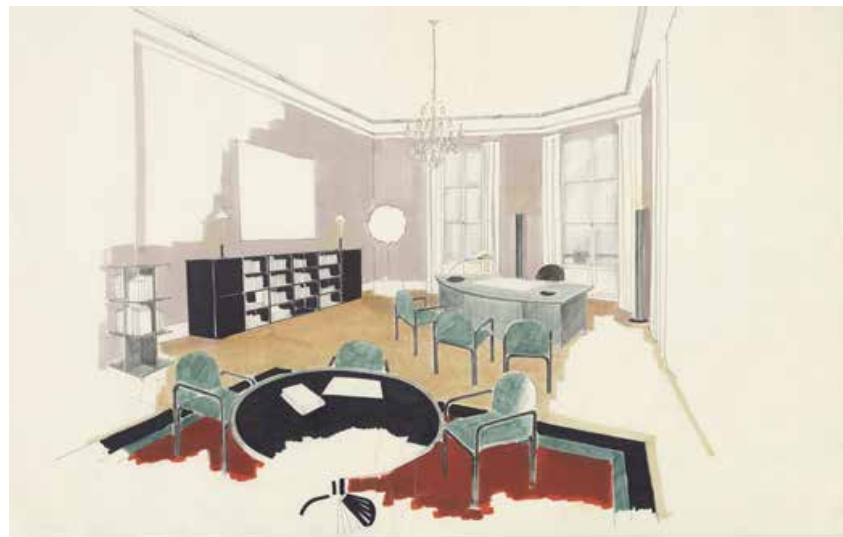
Projet pour le bureau de l'administrateur (1989)