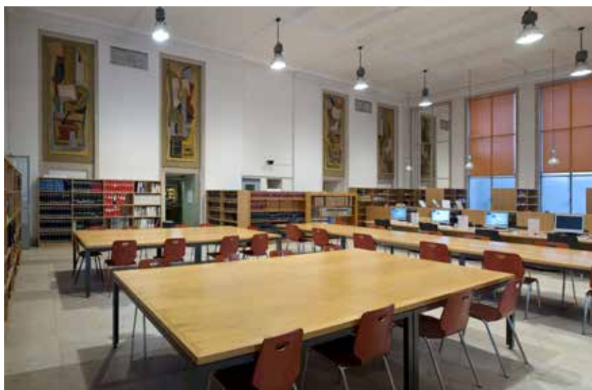
La Salle 1 en 2008