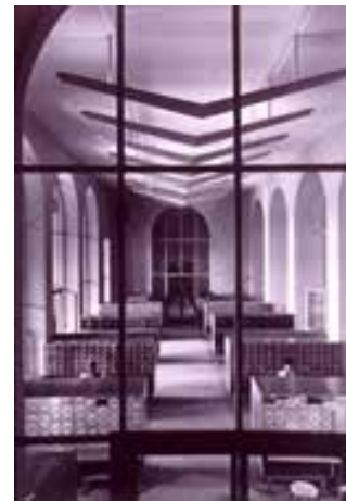
BNU, salle des catalogues (vers 1960)