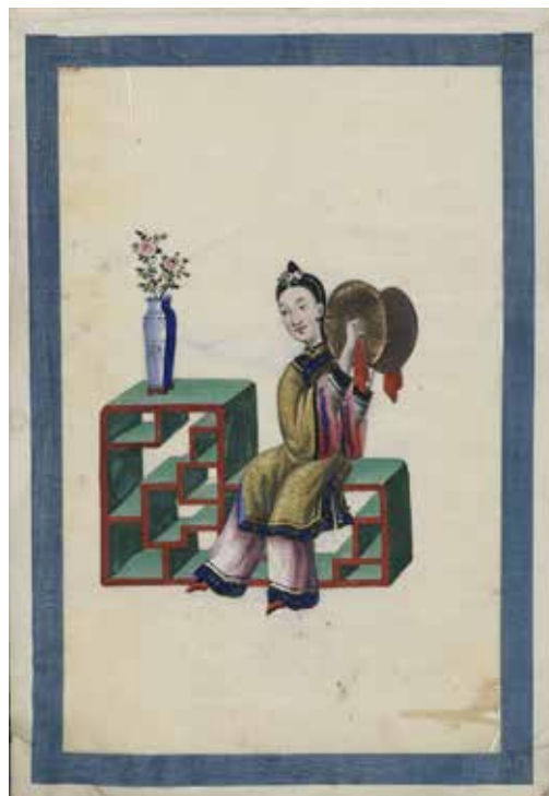
Manuscrit chinois (18 e ou 19 e siècle)