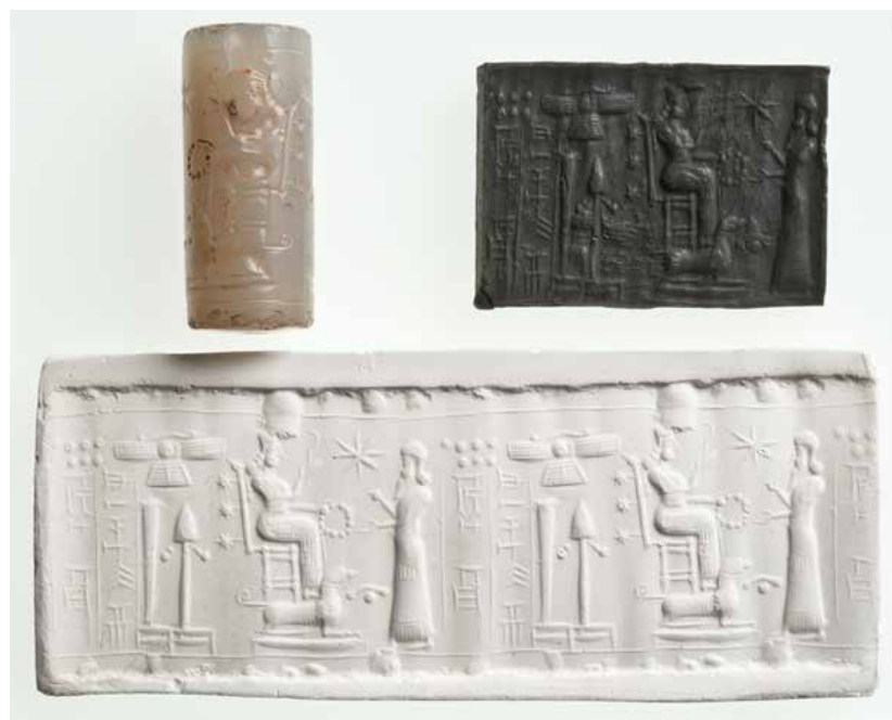
Sceau-cylindre (Assyrie, 9 e siècle avant J.-C.) BNU - JPR