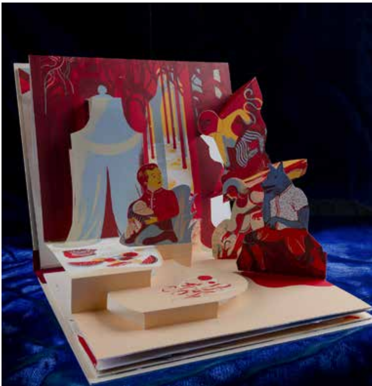
Un livre pop up (2009) / BNU - JPR