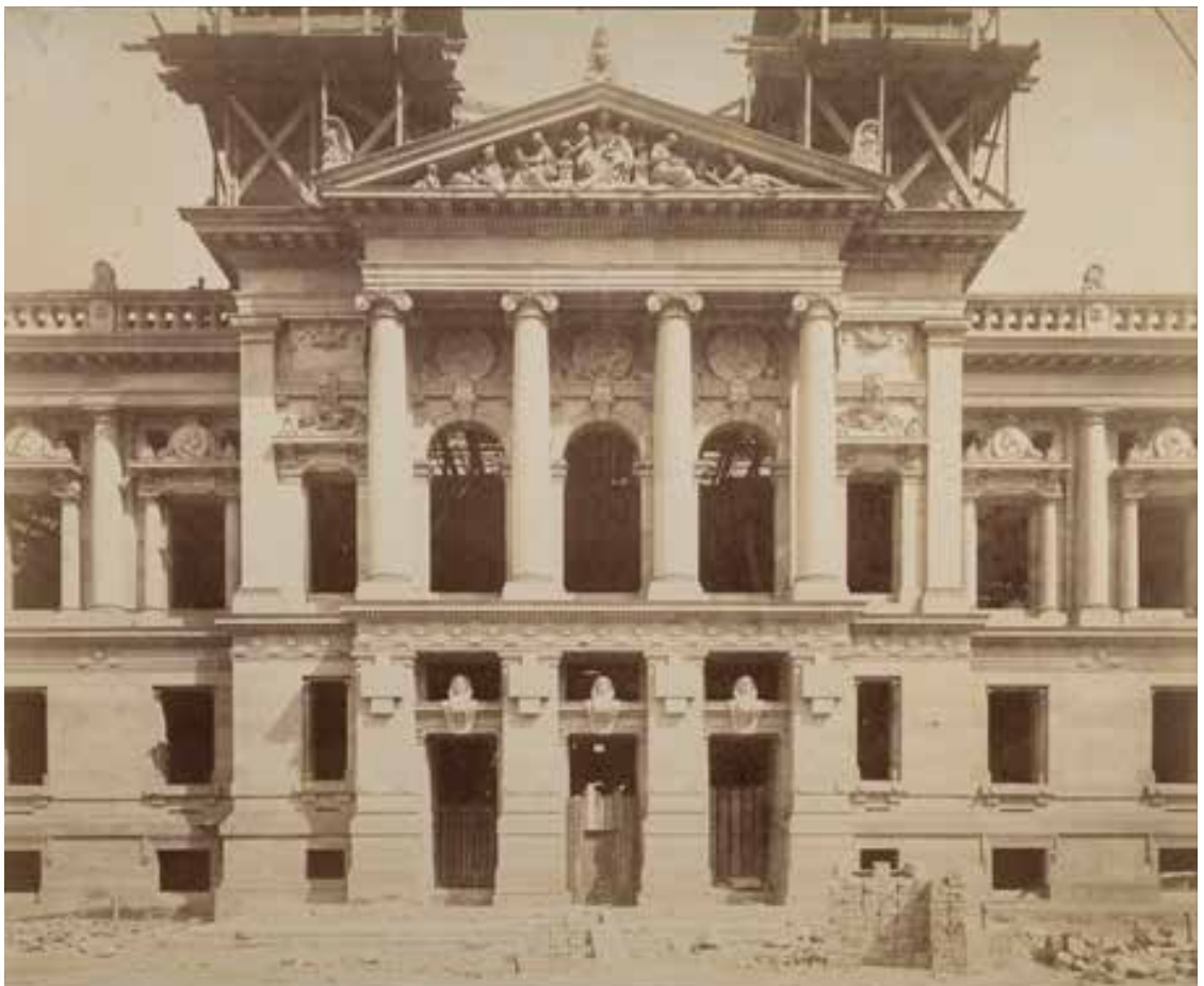
La Kaiserliche Universitäts- und Landesbibliothek (ancêtre de la BNU) en construction (1892)

En 2014, après quatre années de gigantesques travaux, la Bibliothèque nationale et universitaire rouvre son bâtiment principal au public. L'exposition entend marquer d'une façon spectaculaire et visuelle (à la hauteur de l'événement) l'entrée de la bibliothèque, totalement repensée architecturalement et intellectuellement, dans une nouvelle ère. Le titre choisi est bien entendu emblématique du concept général de l'exposition et de l'événement. Souvent employé d'ailleurs par les médias après la réouverture, il est donc en symbiose avec l'actualité, en même temps qu'il révèle une autre dimension, à la fois intellectuelle et patrimoniale, de la bibliothèque, dépositaire et témoin de l'aventure de l'écrit de ses origines à nos jours.